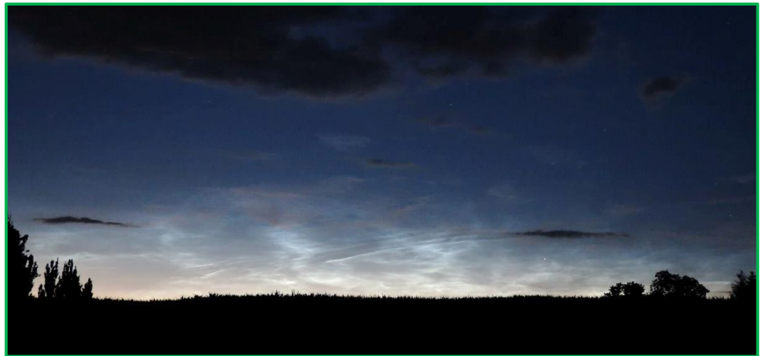
noční svítící oblaka

V červnu a v červenci 2025 bude opět možné vyhlížet noční svítící oblaka (NLC). Jedná se o nejvýše se vyskytující oblaky v atmosféře (asi 80 km). Jsou tvořeny krystalky zmrzlé vody.